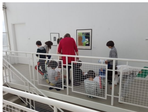
Visite des élèves de l'école de la Pince Guerrière de Châteaugiron