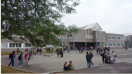
Collège Victor Ségalen

(Coopérer pour Rendre l'Elève Acteur du Développement de son Autonomie )